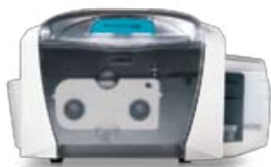
Impresora Persona C30e para impresión por una sola cara

La versatilidad de la impresora Persona C30e también se hace evidente en los tipos de tarjeta que acepta. La impresora C30e puede trabajar con tarjetas de distinto grosor: desde 9 milésimas hasta 40 milésimas de pulgada. Esto significa que admite desde las nuevas tarjetas delgadas de identificación hasta tarjetas de proximidad clamshell y tarjetas inteligentes con circuitos electrónicos incrustados. Las tarjetas plásticas delgadas están adquiriendo gran popularidad en el