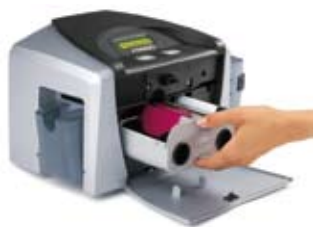
Impresora DTC400e para impresión de una sola cara

La impresora DTC400e es una opción excelente para negocios pequeños y medianos, escuelas de educación primaria y secundaria, departamentos de seguridad pública, agencias regionales de gobierno, instalaciones de gobierno local como bibliotecas y parques, pases para actividades recreativas, eventos y más. Por su tamaño pequeño, la impresora DTC400e resulta ideal para organizaciones que operan en varios edificios o que necesitan imprimir tarjetas en el sitio.