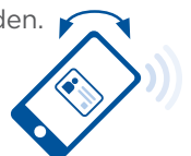
Twist & Go