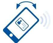
Twist & Go