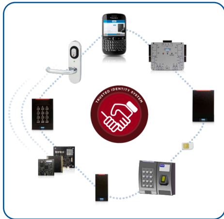
Plateforme iCLASS iCLASS SE®